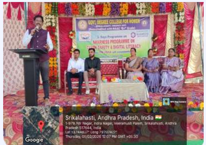
Srikalahasti, Andhra Pradesh, India 1-979, Ntr Nagar, Indra Nagar, Veeramusti Palem, Srikalahasti, Andhra Pradesh 517644, India Lat 13.744859° Long 79.707432° Thursday, 05/02/2026 12:07 PM GMT +05:30