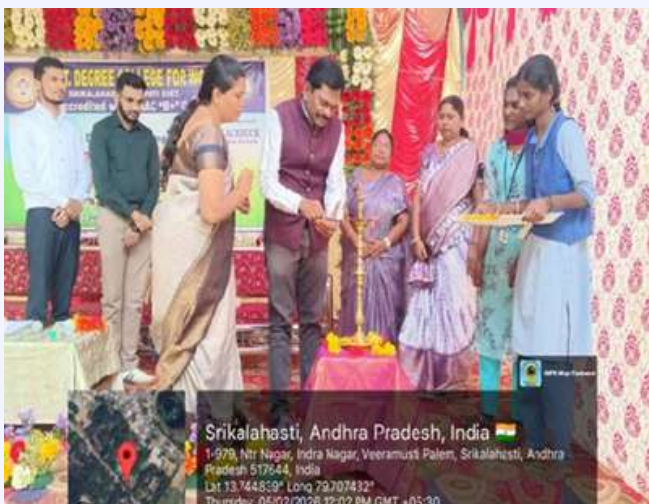
Srikalahasti, Andhra Pradesh, India 1-979, Ntr Nagar, Indra Nagar, Veeramusti Palem, Srikalahasti, Andhra Pradesh 517644, India Lat 13.744859° Long 79.707432° Thursday, 05/02/2026 12:22 PM GMT +05:30

Department of Computer Applications conducted a 3 Day Programme about “Awareness in Cyber Safety and Digital Literacy” in collaboration with Blackbuck Education, Hyderabad. The course will run for 03 days i.e 05-02-2026 to 07-02-2026 under the PM-USHA Soft Component Scheme. This initiative is designed To Raise Awareness about common Cyber threats and online frauds, To promote safe and responsible use of Digital devices and Platforms and to educate participants about legal rights and cybercrime reporting mechanisms.