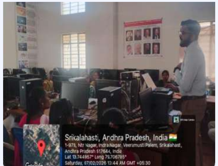
Srikalahasti, Andhra Pradesh, India 1-973, Ntr Nagar, Indra Nagar, Veeramusti Palem, Srikalahasti, Andhra Pradesh 517644, India Lat 13.744957° Long 79.706785° Saturday, 07/02/2026 13:44 AM GMT +05:30