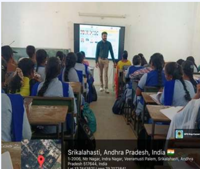
Srikalahasti, Andhra Pradesh, India 1-2006, Ntr Nagar, Indra Nagar, Veeramusti Palem, Srikalahasti, Andhra Pradesh 517644, India Lat 13.744352° Long 79.707384°